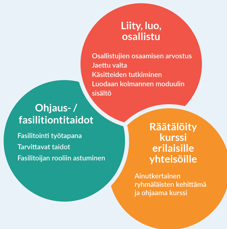
Kuva 1. EEECom kolmivaiheinen koulutusprosessi